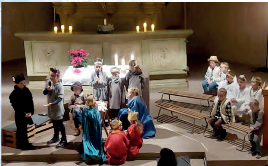
Szene aus unserem letztjährigen Weihnachtsmusical „Die Weihnachtsmäuse“.